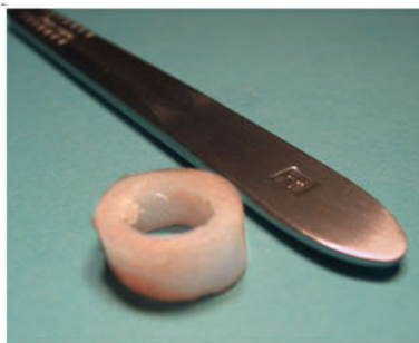
図-8 短い皮質骨分節（リング状）