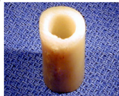
図-6 海綿骨のドウェル（筒状移植片）