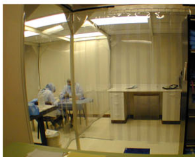
図-1 クリーンルームの内部と入口

ロンジュールで海綿骨を処理してチップ状としたもので、通常の骨折時に欠損部位に埋め込んだり、関節固定術やTPLO (脛骨高平部水平化手術) 等にも使用できる。自家骨移植片の代替品となるため手術方法も同じである。チップ状の構造が骨伝導の接触面として機能し、骨誘導の成長因子も保有する 1) 。海綿骨チップの単独使用も可能だが、凍結した際に消失した骨形成能を補完するために自家骨移植と併用したり、骨髓やミネラル除去したパウダーと混合して使用することもできる。