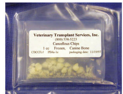
図-3 海綿骨チップのパッケージ。2重パッケージでドナー情報が追跡調査できるように移植記録が貼付してある。