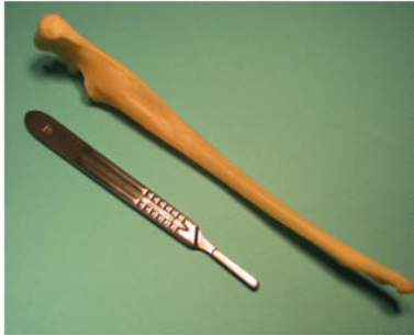
図-10 尺骨全体の移植片