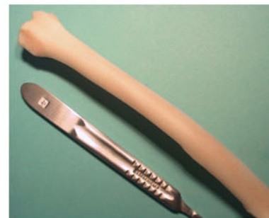
図-9 橈骨全体の移植片