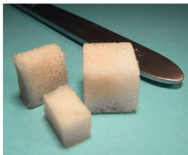
図-5 海綿骨ブロック